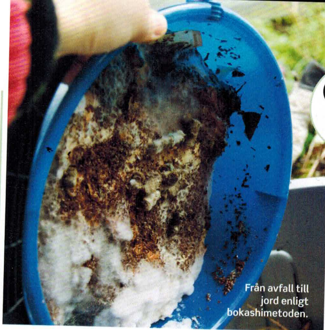
Från avfall till jord enligt bokashimetoden.

Välj om det ska vara kvadratiska eller trekantiga lådor. Ett snyggt mönster gör köksträdgården till en prydnad året om. Fyll på med bra jord, helst ekologisk, tillsammans med väl förmultnad kompost och gödsel samt eventuellt biokol.