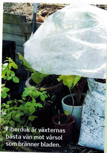
Fiberduk är växternas bästa vän mot vårsol som bränner bladen.

→ Den starka vårsolen kan bränna bladen på växter som kommer från växthus, inomhusodling eller butik. Bladen blir brända och behöver vänja sig på ungefär samma sätt som människohud. Sätt därför allra helst ut plantorna en mulen dag och skydda med fiberduk den första tiden.